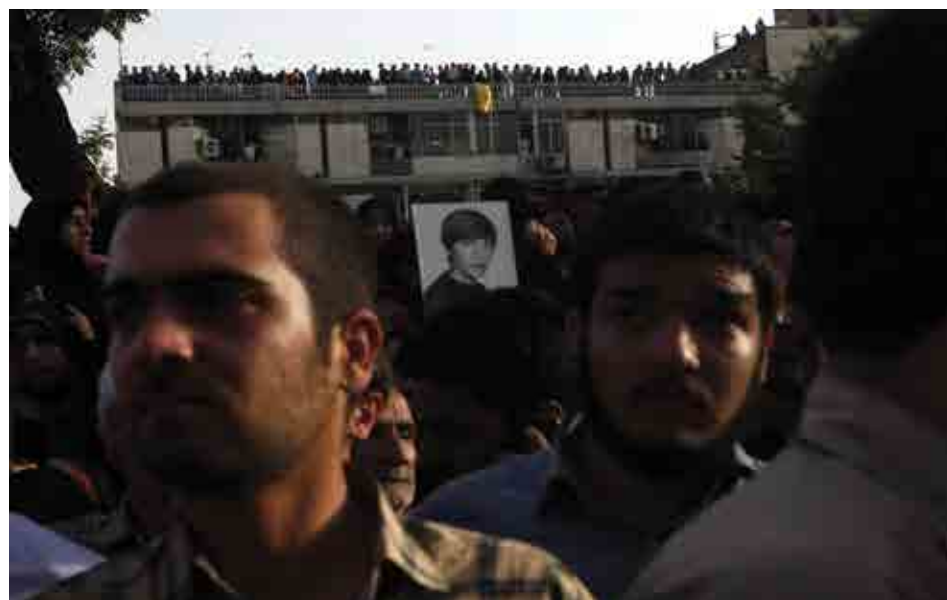
محمود رحیمی / بدون عنوان / تهران، میدان بهارستان /