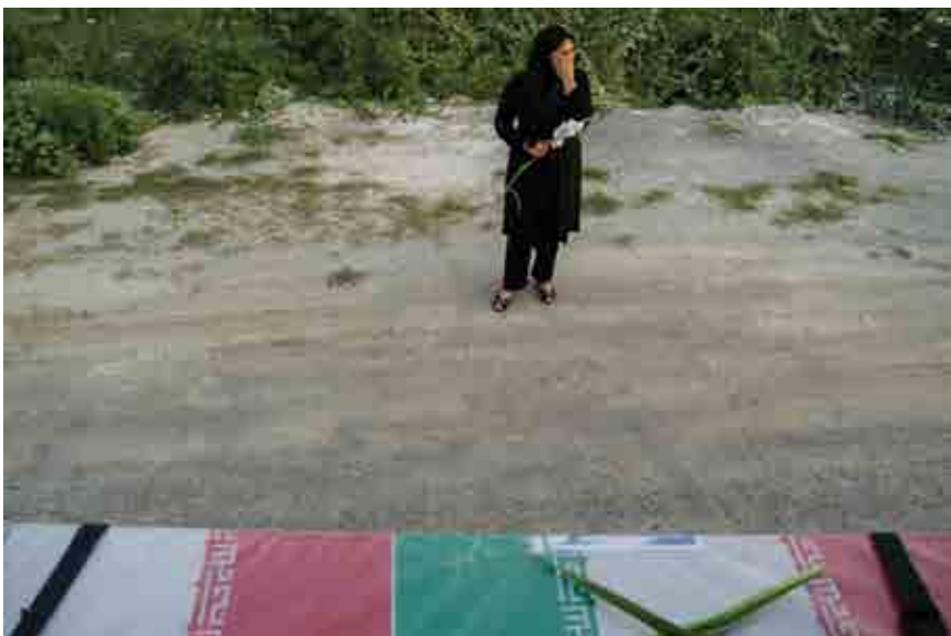
حامد پراکنده/گذر/مازندران، بین نور و محمودآباد/