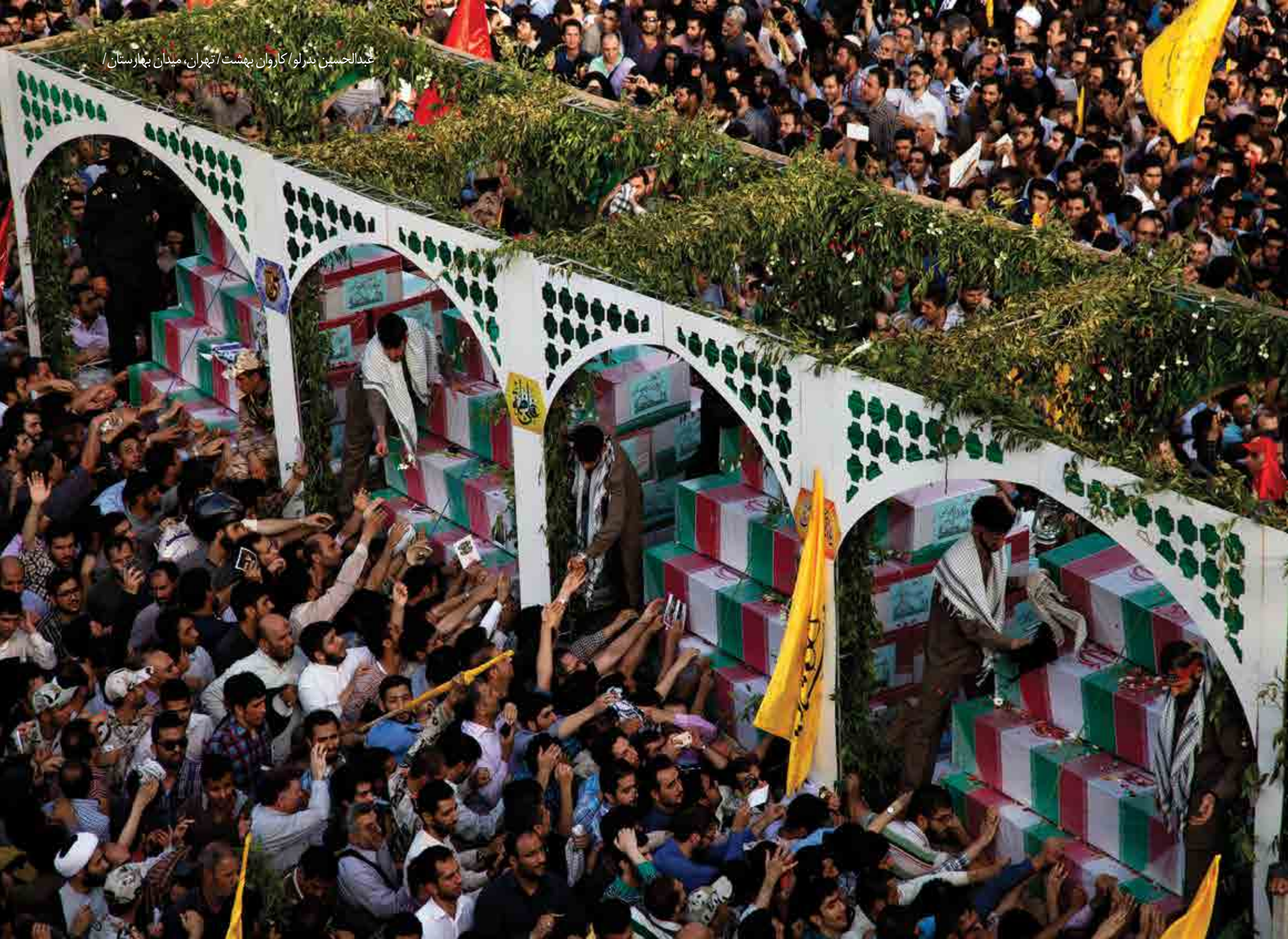
عبدالحسين بدرلو / کاروان بهشت / تهران، میدان بهارستان /