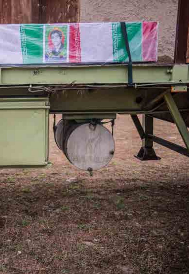
محمد رضایی / بدون عنوان / آمازندران، حاشیه شهرستان قائمشهر /