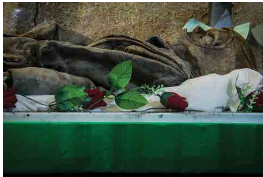
محسن رنگین کمان / اغواص شهید / تهران، معراج شهیدا /