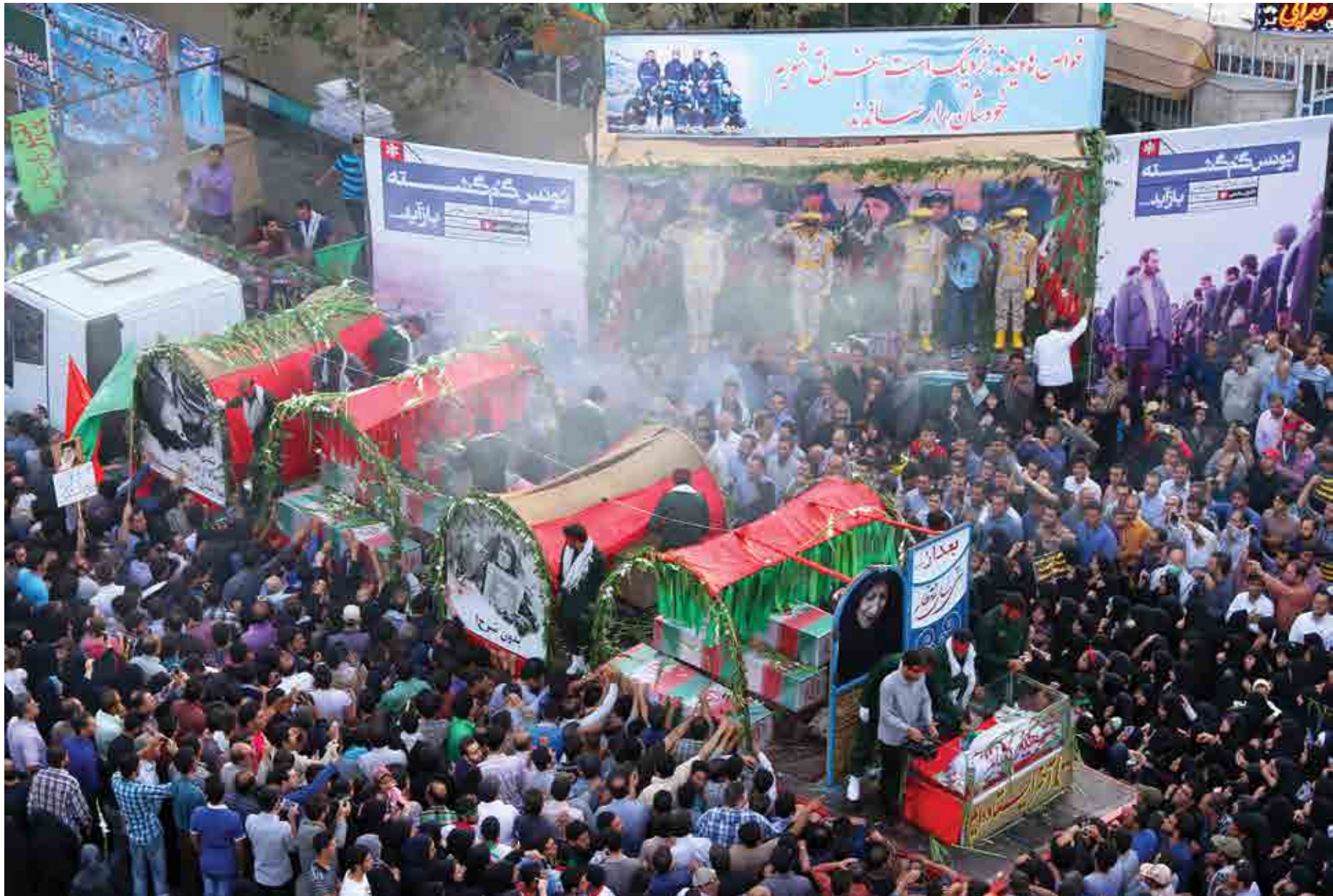
سید مهدی خیام الحسینی / یونس گمگشته باز آید ... / اصفهان، خیابان بزرگمهر /