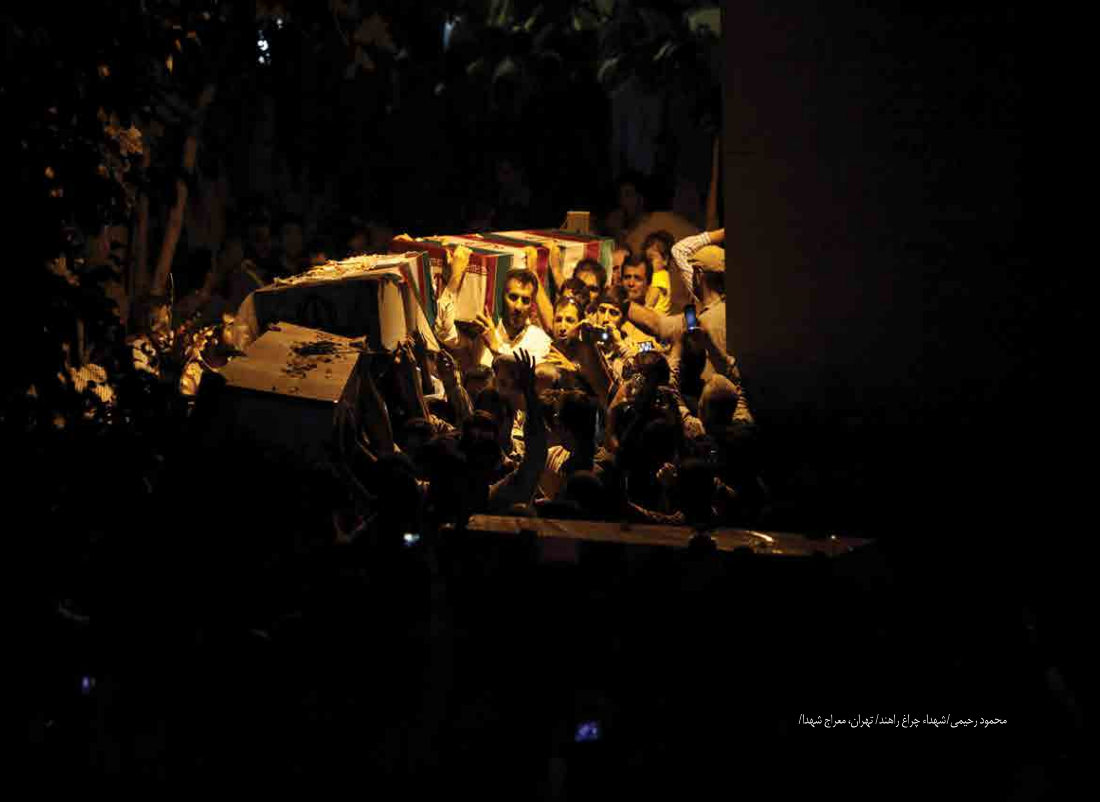
محمود رحیمی / شهداء چراغ راهند / تهران، معراج شهءا /