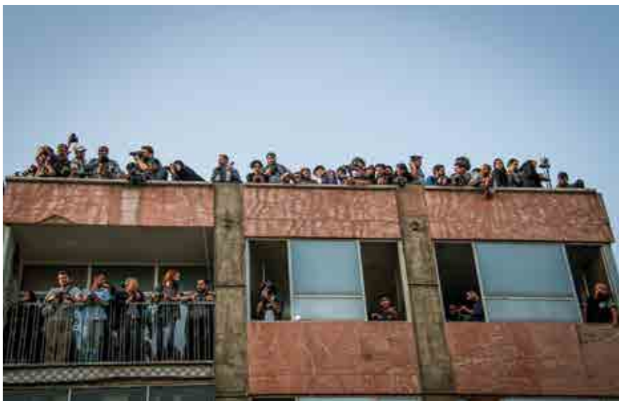
محسن رنگین کمان / چشمان ناظر / تهران، میدان بهارستان /