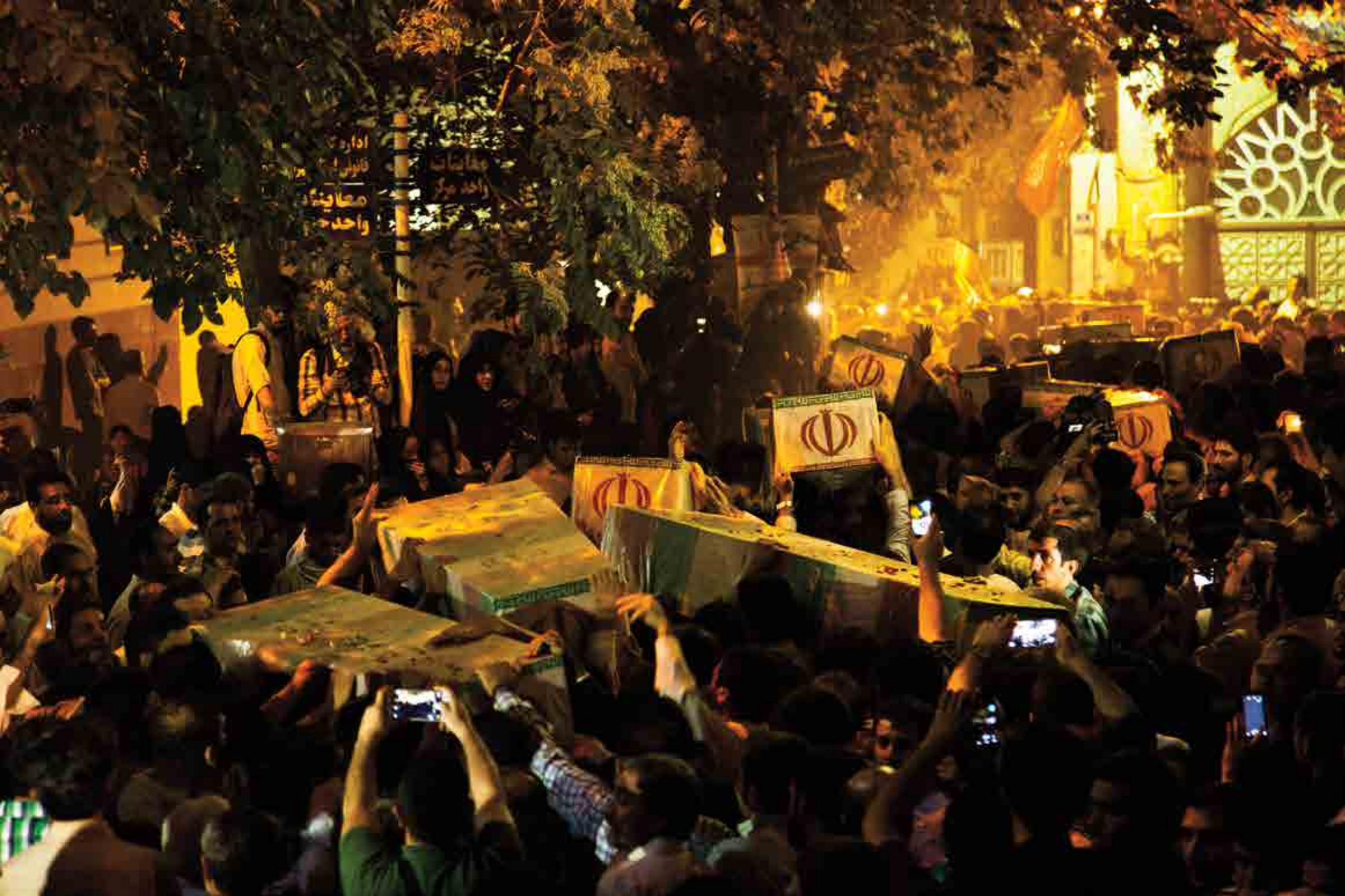
عبدالحسين بدرلو / نور / تهران، معراج شهيدا/