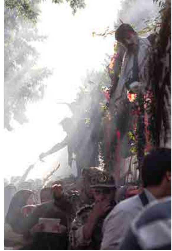
احمد صالحی بدون عنوان / اصفهان، خیابان بزرگمهر /