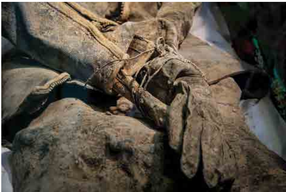
محسن رنگین کمان / داستان بسته باز / تهران، معراج شهیدا /