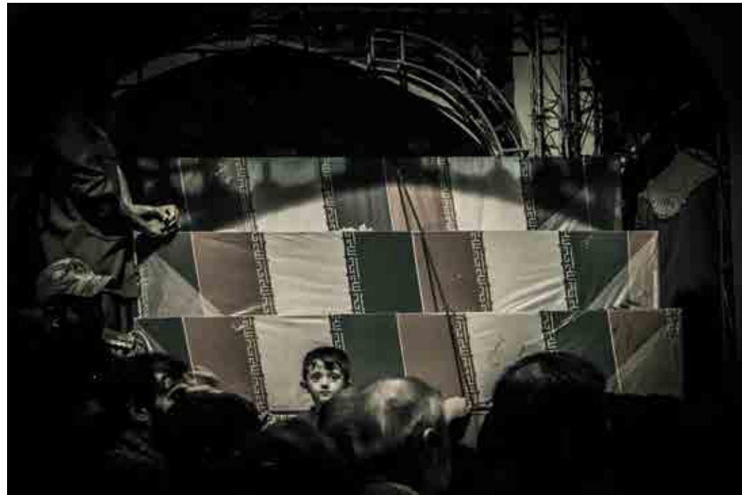
حسنا فولادپور / بدون عنوان / تهران، پارک شهر /