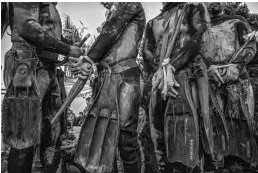
امیرحسین کمالی / غواصان / اصفهان، خیابان بزرگمهر /