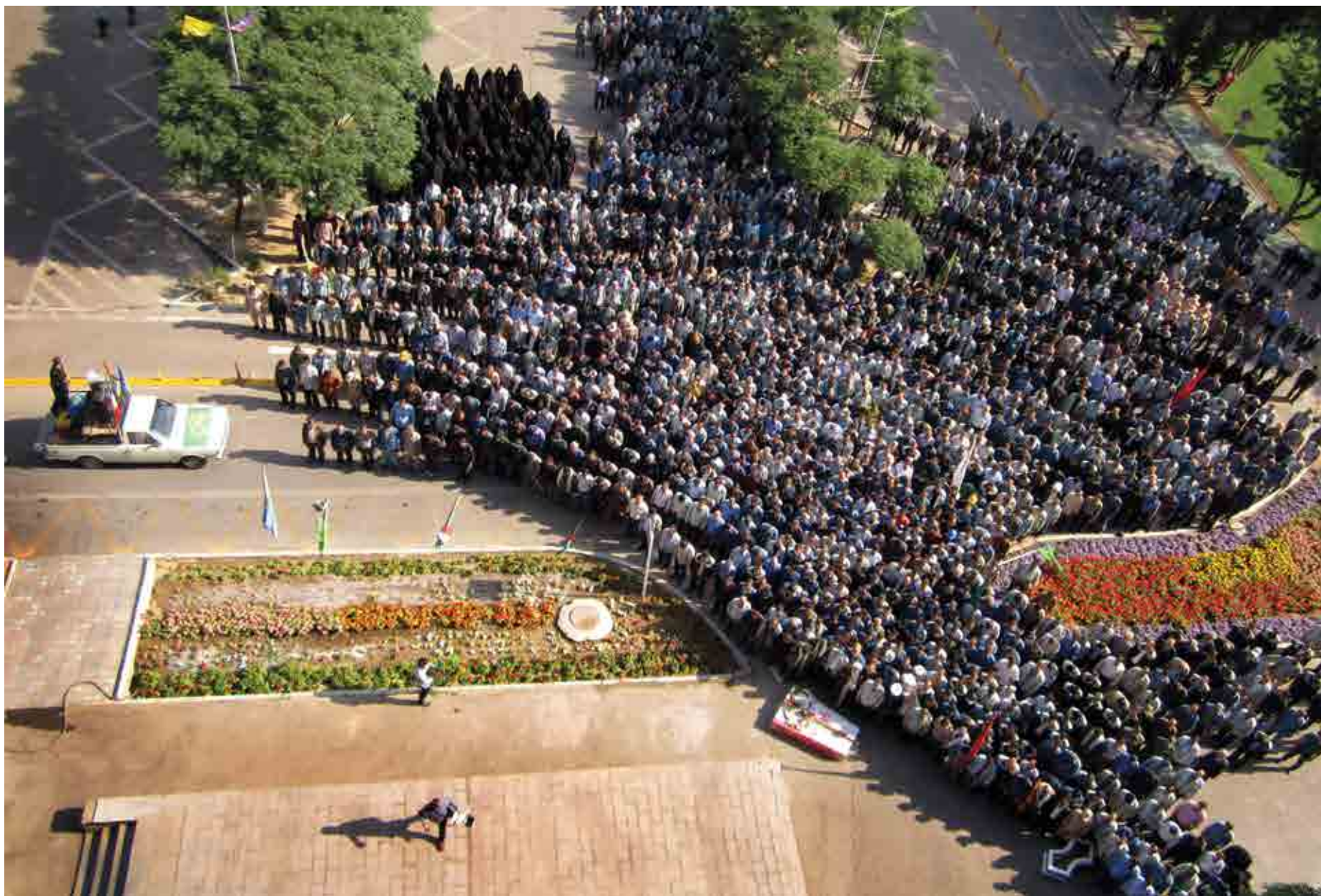
رسول پورپیر علی / نمازی بر پیکر شهید / اصفهان، شرکت سهامی ذوب آهن /