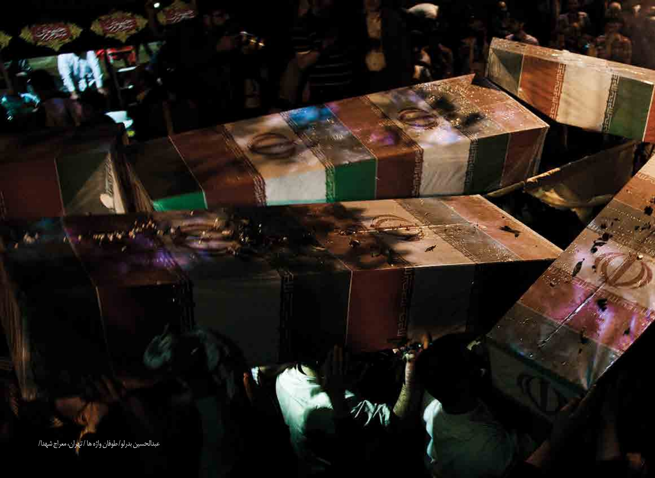
عبدالحسين بدرلو / طوفان واژه ها / تهران، معراج شهيدا /