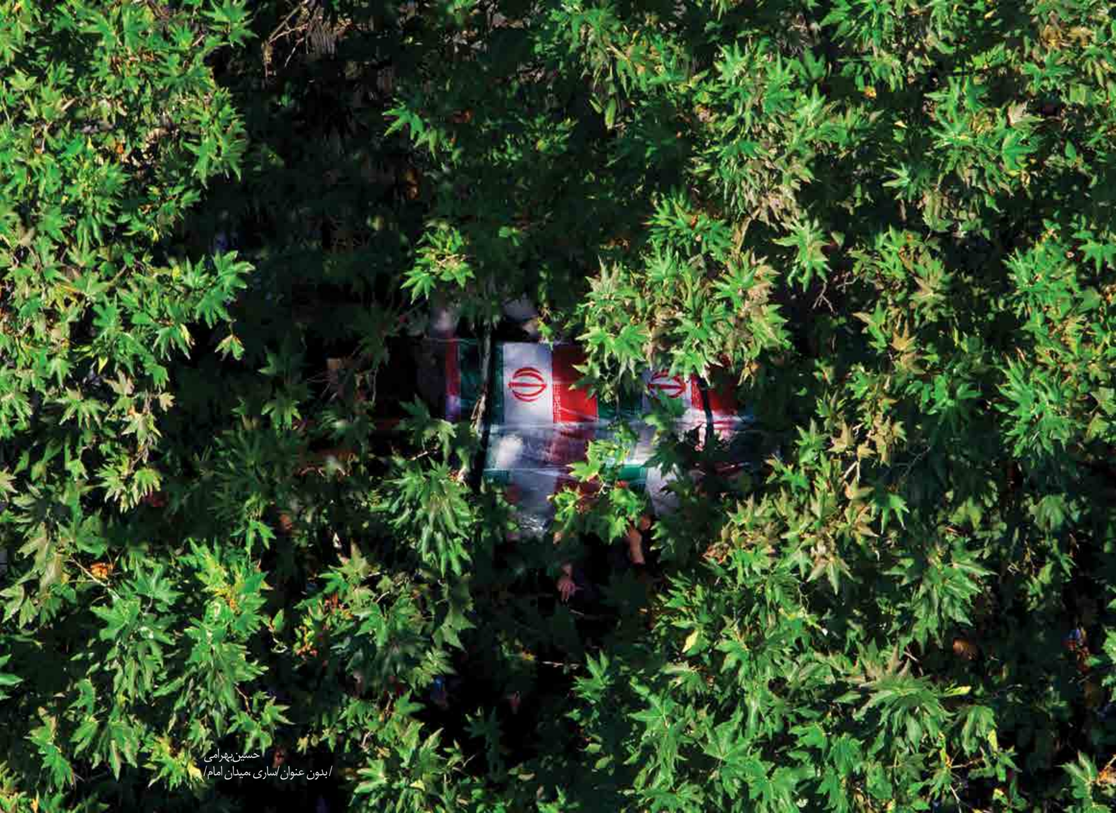
حسین بهرامی / بدون عنوان / ساری، میدان امام /