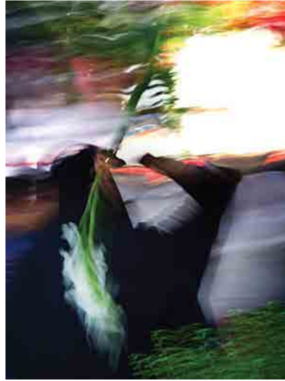
احمد صالحی / بدون عنوان / اصفهان، خیابان نزرگمهر /