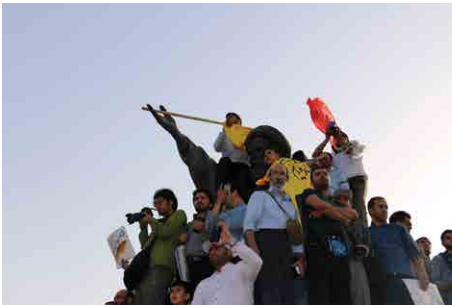
الهه غلامی / به سمت بالا / تهران، میدان بهارستان /