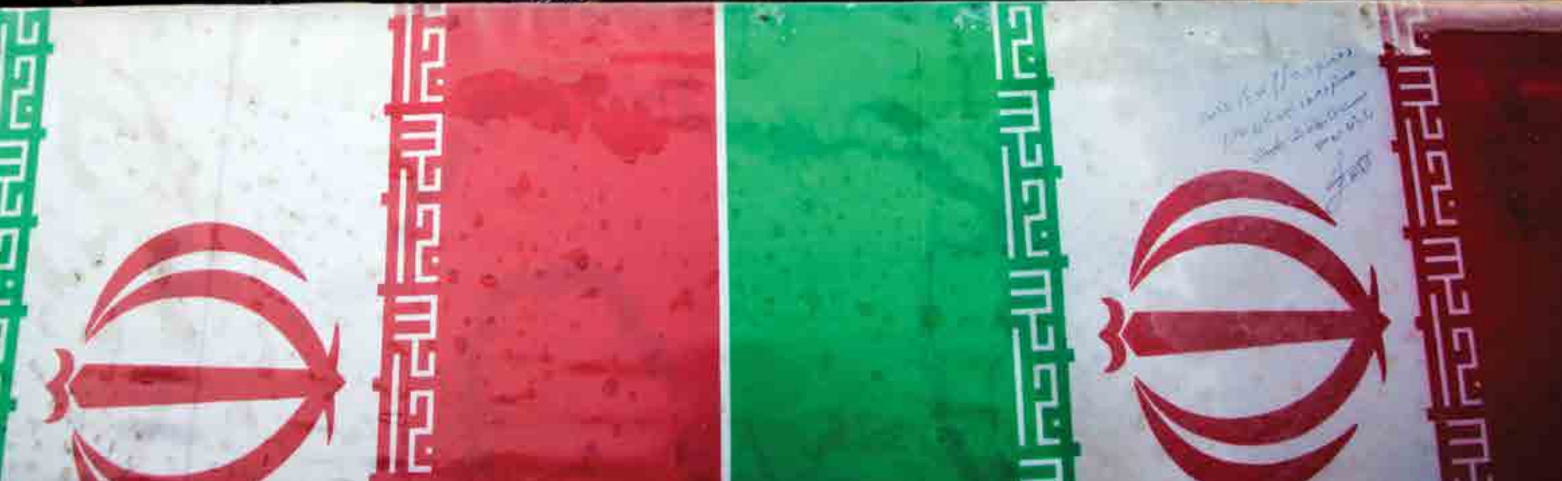
حسین بهرامی / بدون عنوان / مازندران، میدان امام قائمشهر /