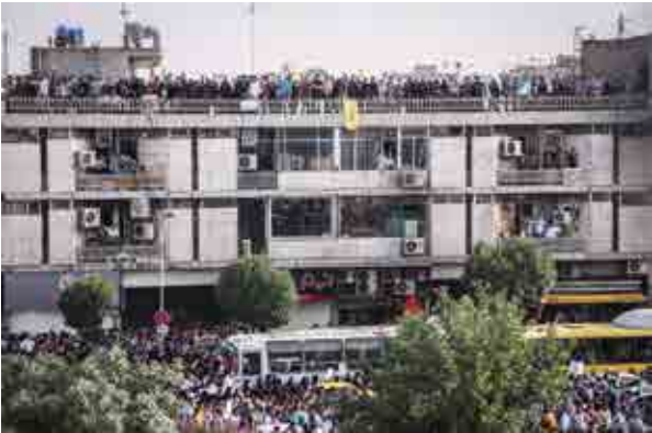
سارا رجایی / بدون عنوان / تهران، میدان بهارستان /